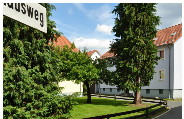
Wohnanlage der GEWOG Bad Berneck eG im Falkenhausweg.